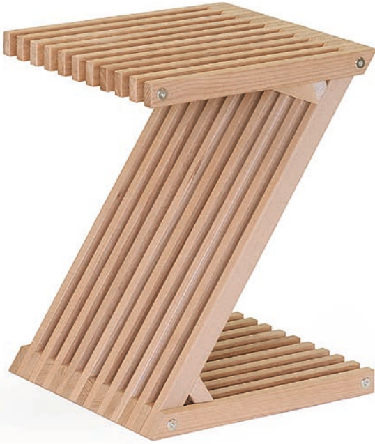
Der Z-Hocker ist eines der meist verkauften Produkte aus dem Sortiment von Contact Arbeit «Holz + Textil».

ich mich auf diese Stelle beworben habe. Ich hatte nie zuvor mit Drogenabhängigen gearbeitet.» Er musste lernen: Unverbindlichkeit und Unzuverlässigkeit gehören in der Arbeit mit dieser Klientel dazu. Die Sucht dominiert ihr Leben. «Einige haben viel Interessantes zu erzählen und einen guten Humor.»